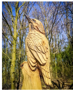
ijsvogel (Beeldhouwer Dirk Reinders)

De carnavalsvereniging "De Blauwkoppen" herinnert aan die periode. De aspergekopjes werden namelijk blauwig als ze te lang boven de grond uitstaken.