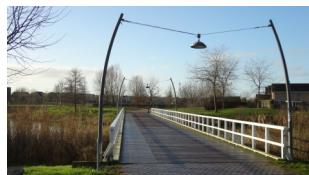
Verbinding tussen Huurlingsedam-Kerkeveld

Stichting Natuur en Milieu Wijchen heeft langs het voetpad bij het meer paaltjes geplaatst met daarop de vermelding welke dieren te zien zijn. Eveneens ligt in het park een drukbezochte skatebaan.